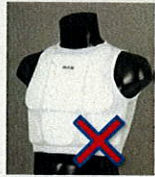
《着用不可のサポーター》